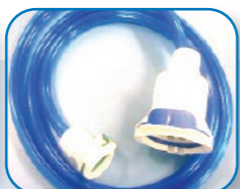
Niebieski przewód przyłączeniowy