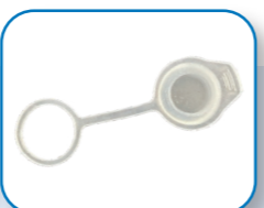
Zatyczka portu nawilżacza