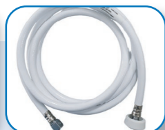
Biały przewód tlenowy