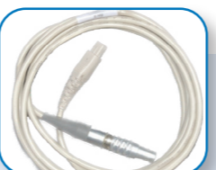
Kabel nawilżacza (beżowy)