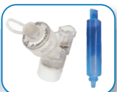
Nawilżacz i fiolka z wodą destylowaną